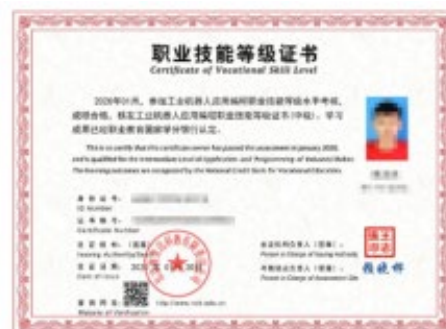
职业技能等级证书